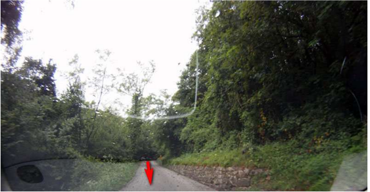
Punto di interesse GPS - > Erbezzo End