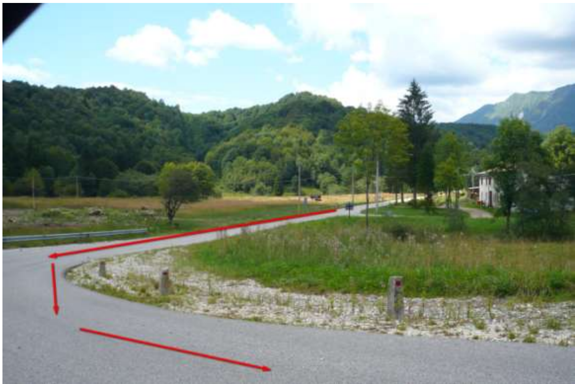
Punto di interesse GPS -> Taipana 4