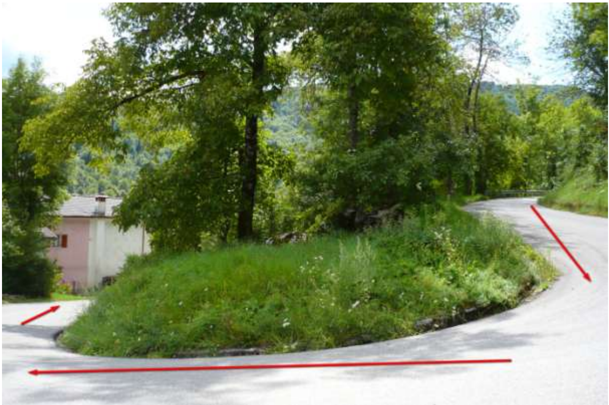
Punto di interesse GPS -> Taipana 6