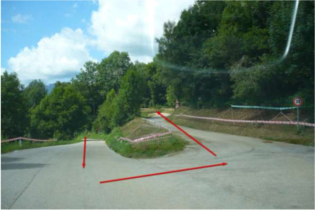
Punto di interesse GPS -> Taipana 3