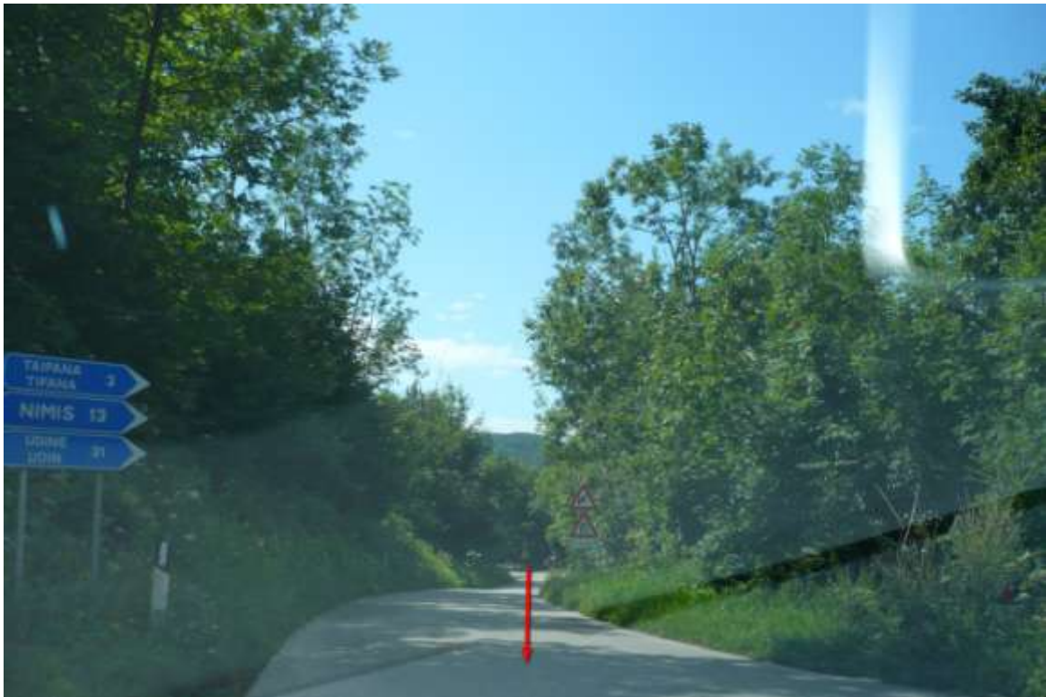
Punto di interesse GPS -> Taipana 2