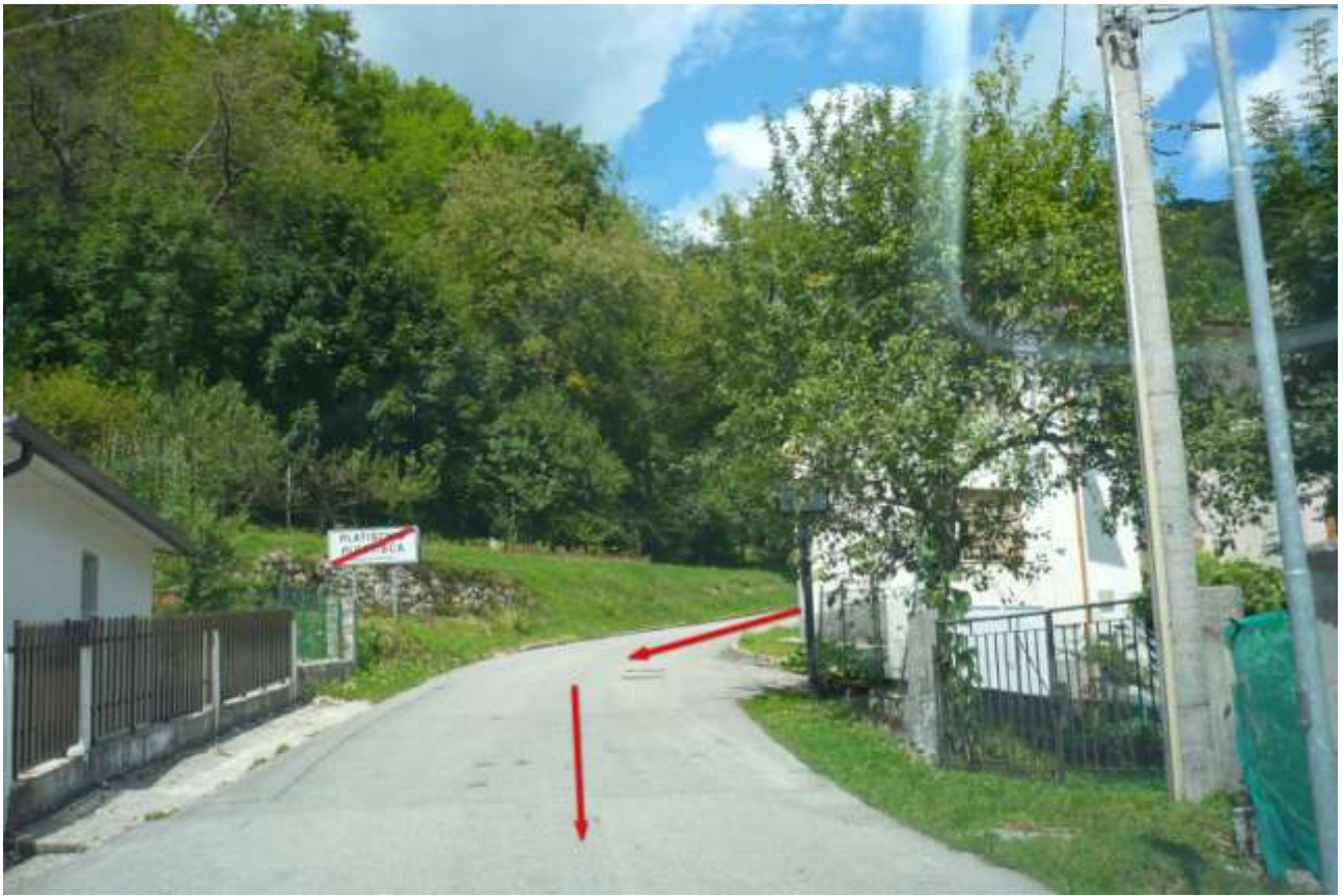
Punto di interesse GPS -> Taipana end