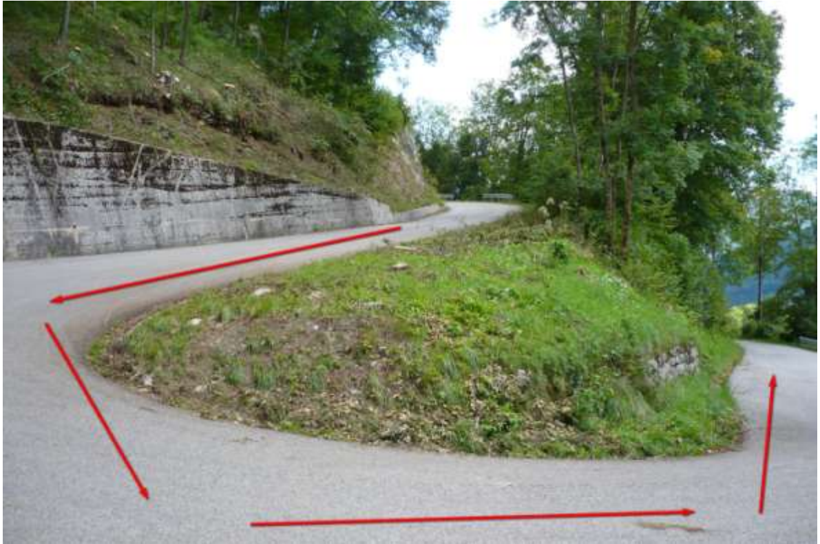
Punto di interesse GPS -> Taipana 5