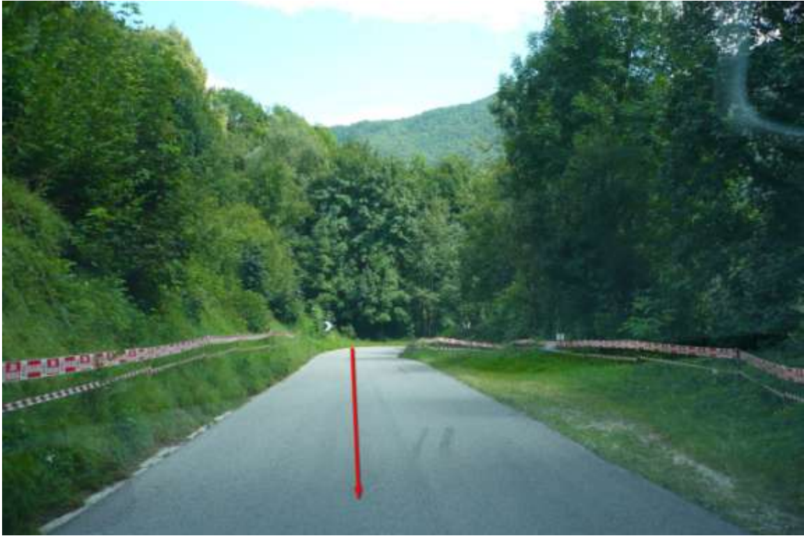
Punto di interesse GPS -> Taipana Start