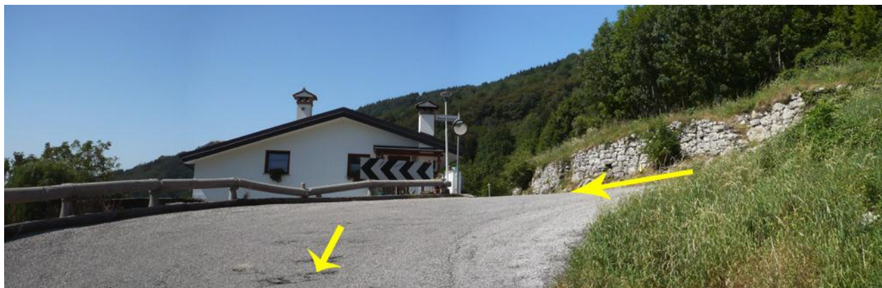
Naviga verso : Canebola 4 (1km a piedi dopo il parcheggio all'inversione)