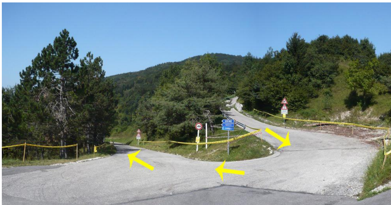
Naviga verso : P – Canebola inversione (2)