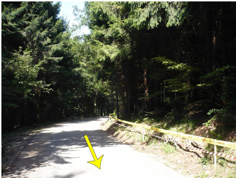
Inizio prova speciale – Naviga verso : P – Canebola start

Video fine prova speciale : http://youtu.be/U7LjYPgsJoQ