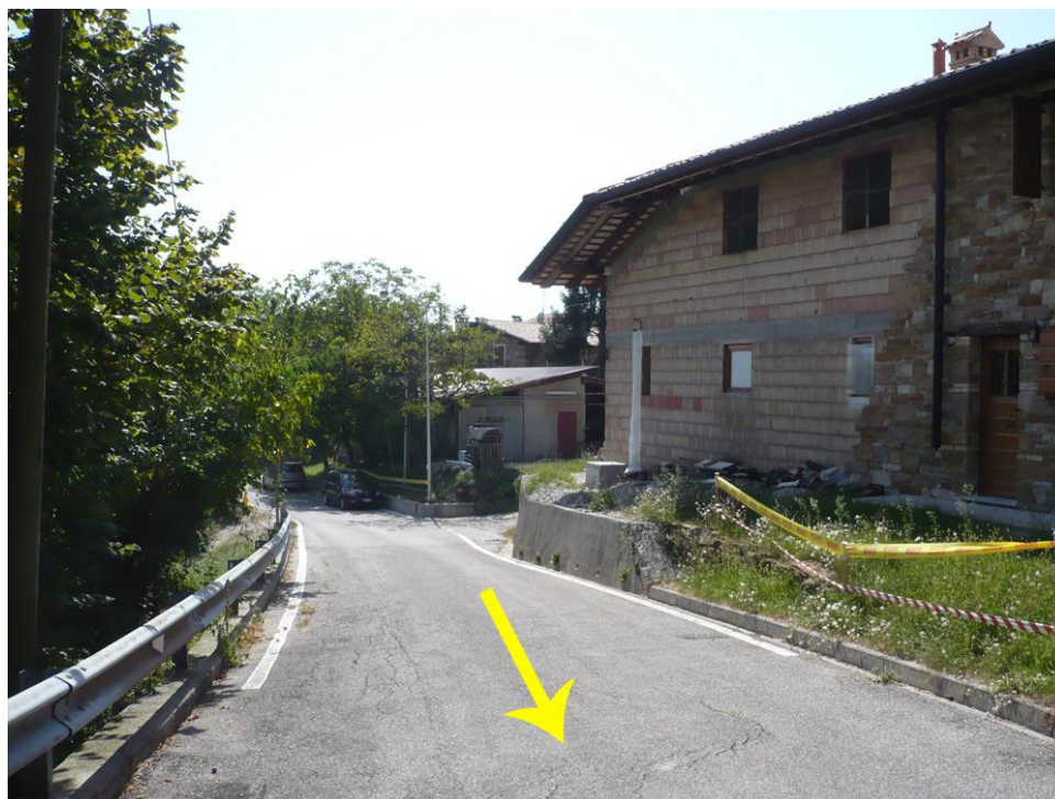
Inizio prova speciale - Naviga verso : P - Valle start

Video fine prova speciale : http://youtu.be/Uyt1tSOKYMc