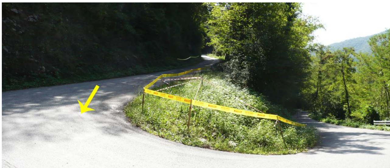
Naviga verso: Valle 2 | 600m dal fine prova