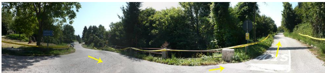
Naviga verso: Valle 1 (necessario ingresso in prova)