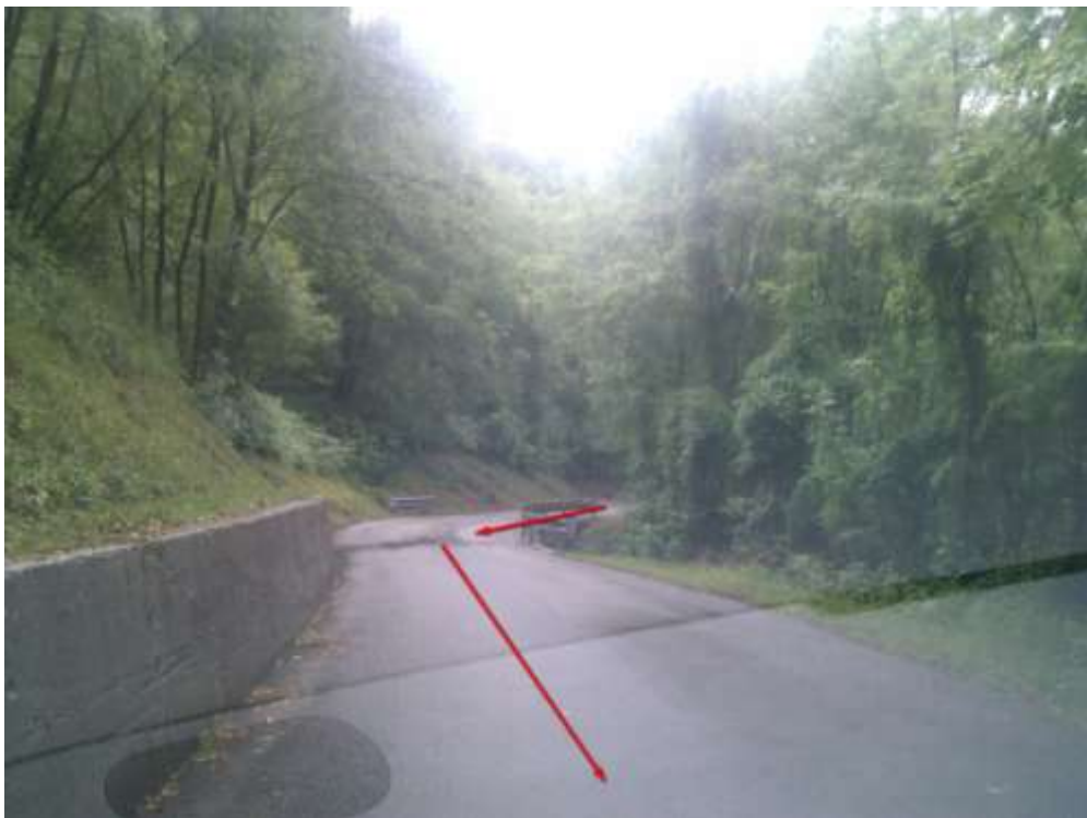
Punto di interesse GPS - > Erbezzo 1