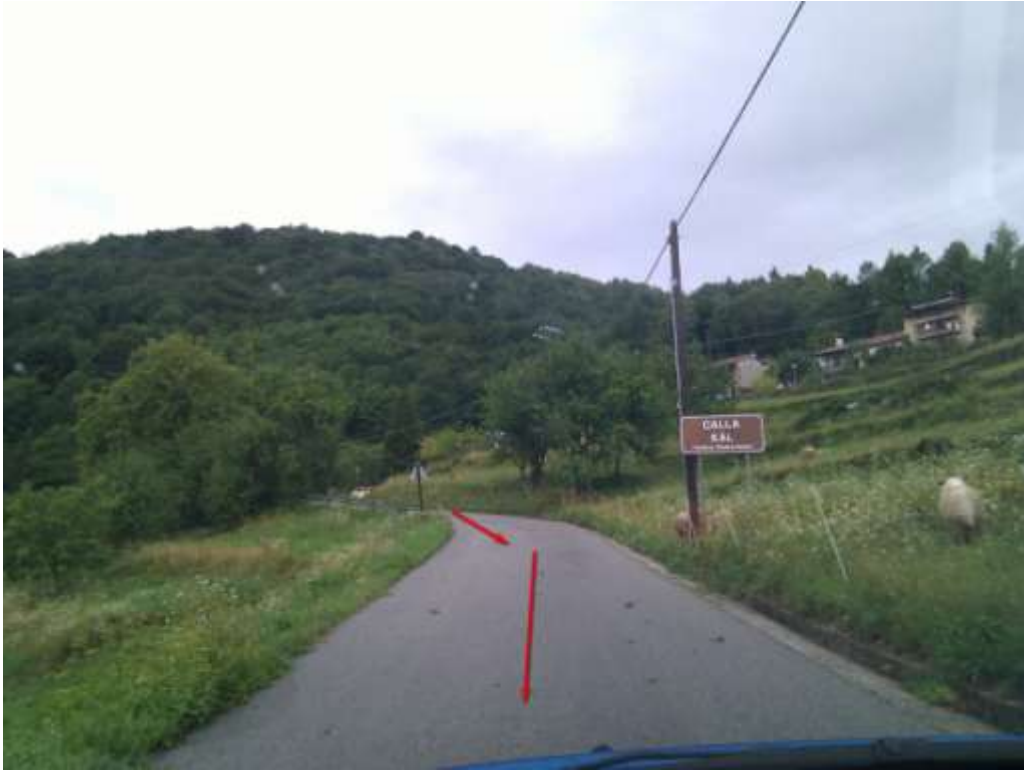
Punto di interesse GPS - > Erbezzo 2