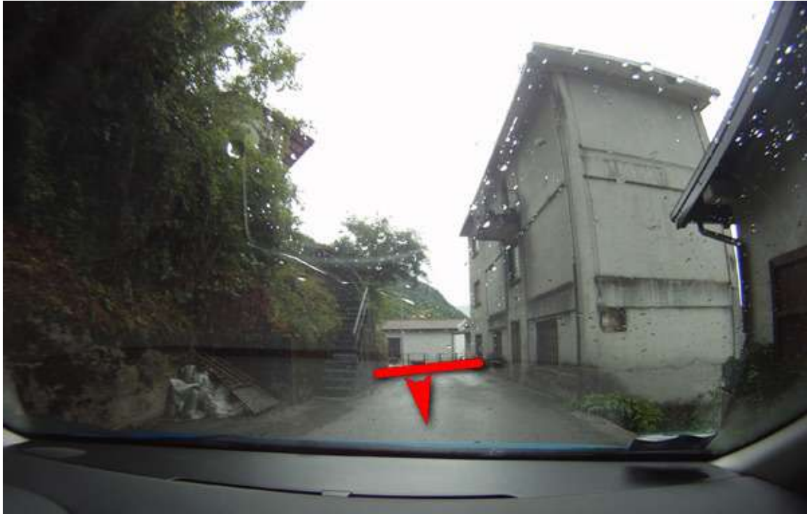
Punto di interesse GPS - > Erbezzo Start