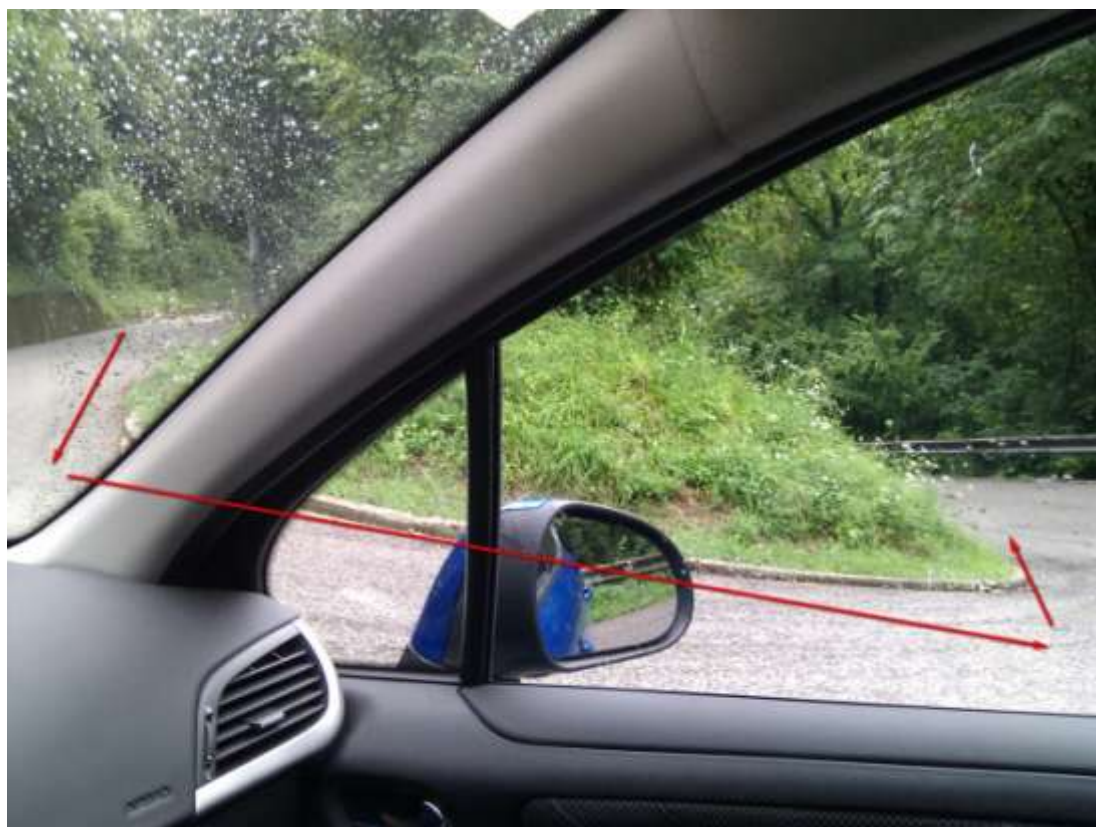
Punto di interesse GPS - > Erbezzo 5