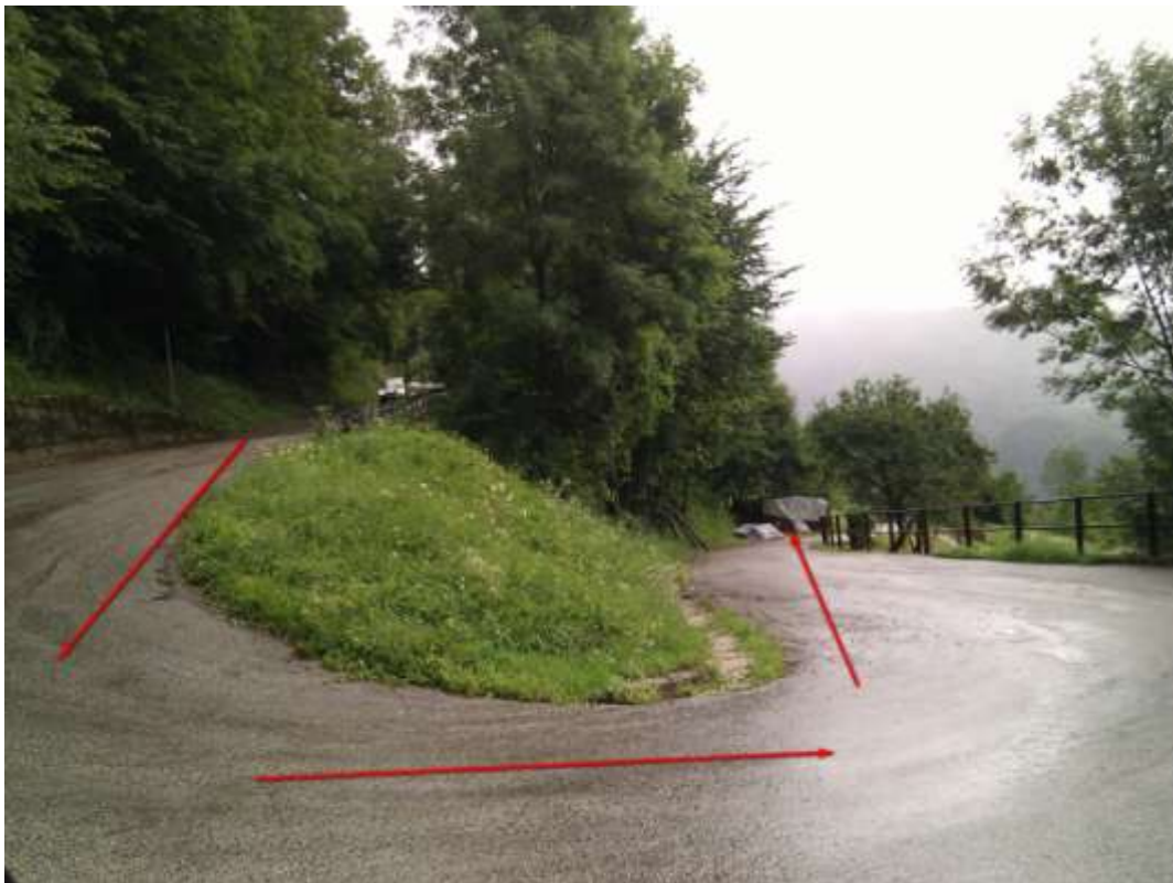
Punto di interesse GPS - > Erbezzo 3