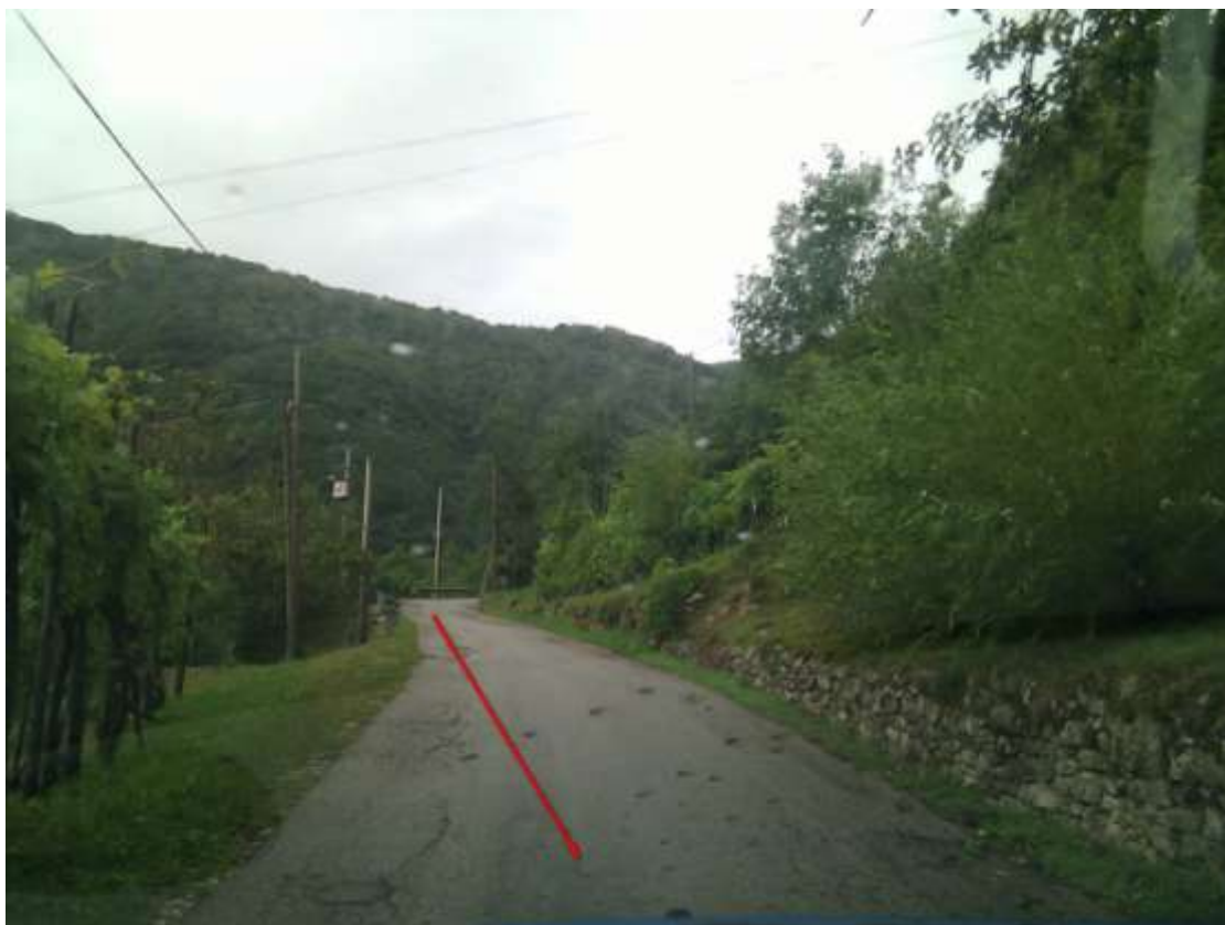
Punto di interesse GPS - > Erbezzo 4