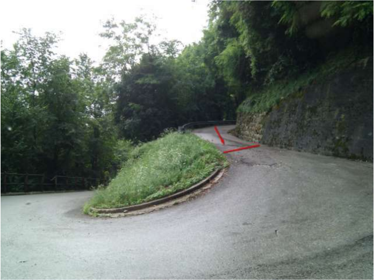
Punto di interesse GPS - > Erbezzo End